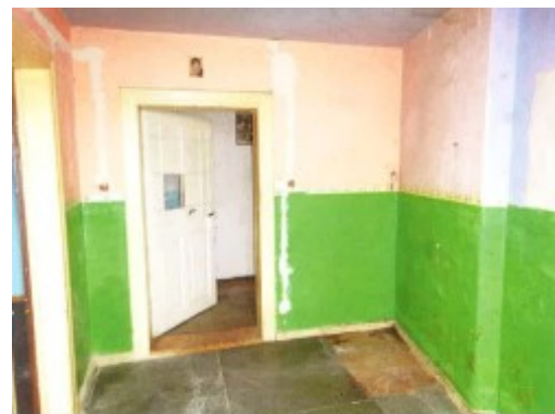
Widok fragmentu kuchni.