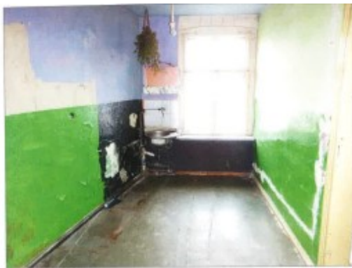
Widok fragmentu kuchni.