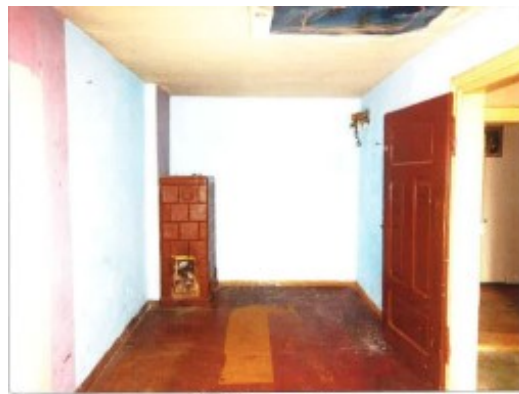
Widok fragmentu pokoju.