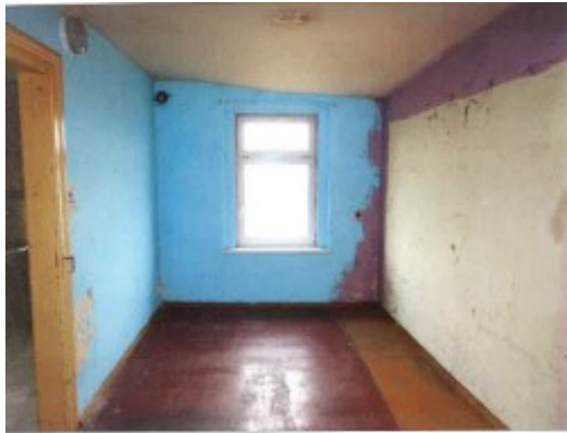
Widok fragmentu pokoju.