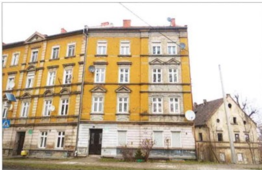
Widok elewacji frontowej – Lubań, ul. Warszawska nr 3.

na sprzedaż lokalu mieszkalnego Nr 5 znajdującego się w budynku położonym w Lubaniu przy ul. Warszawskiej 3 wraz z udziałem we współwłasności nieruchomości gruntowej (działka nr 55, AM 10, Obręb III o powierzchni 145 m 2 , JG1L/00035544/9)