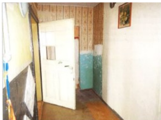
Widok fragmentu przedpokoju.