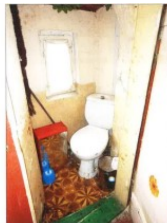
Widok pomieszczenia przyłóżnego – we na półpiętrze.